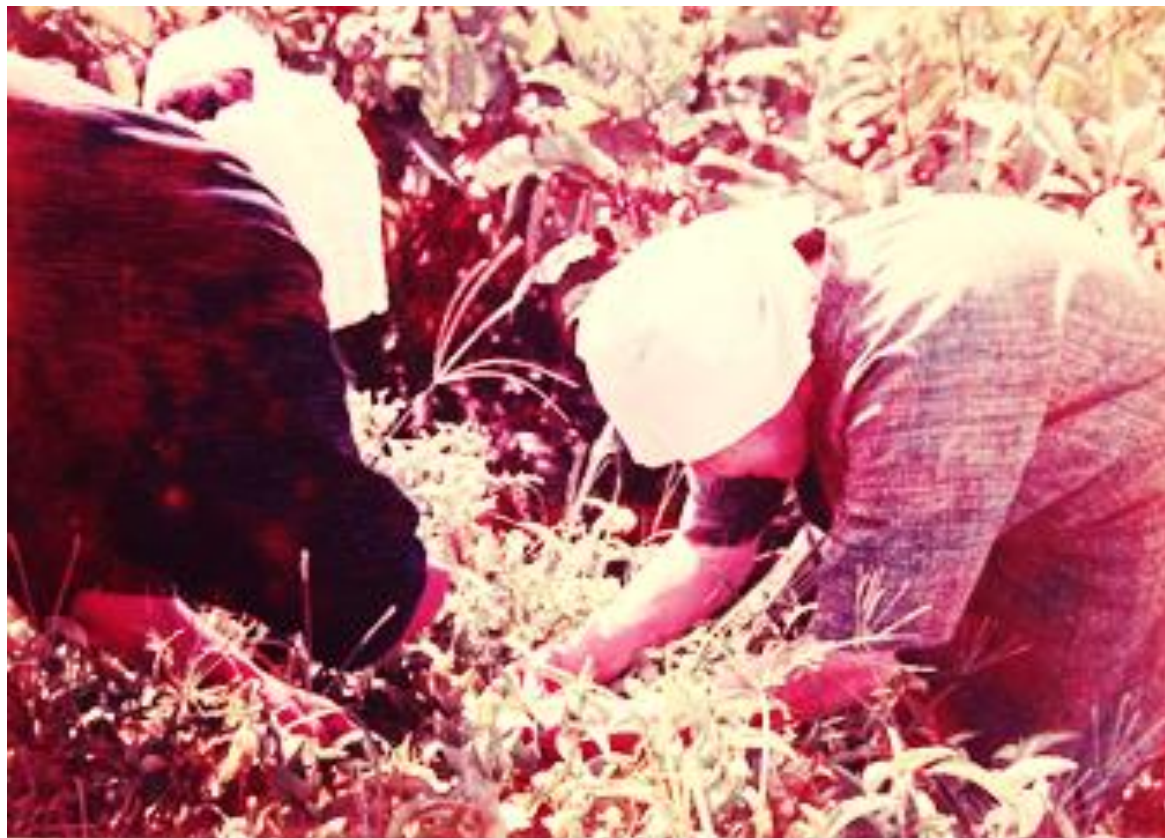
栗東市域での青花栽培の様子（昭和41年ごろ／栗東市上砥山にて）