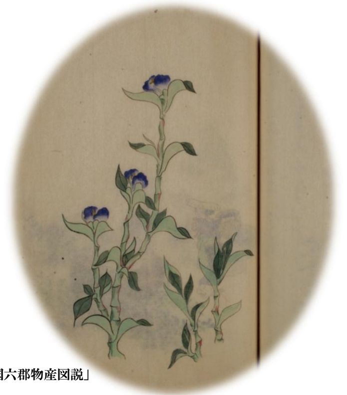
青花／「滋賀県管下近江国六郡物産図説」

*草津市では草津宿街道交流館を会場に、「KURITA BLUE 名産青花紙の生産と流通」を7月30日（土）から9月3日まで開催します。